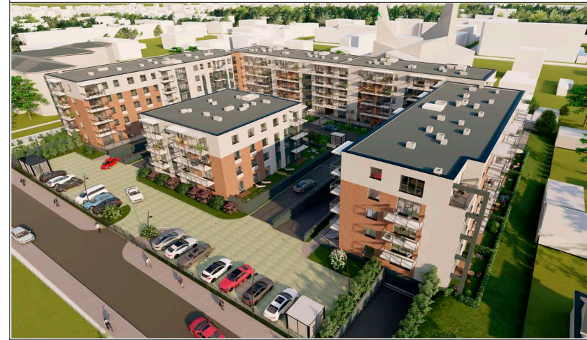
LOKALIZACJA W BUDYNKU