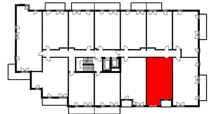
LOKAL MIESZKALNY M35, 2. PIĘTRO