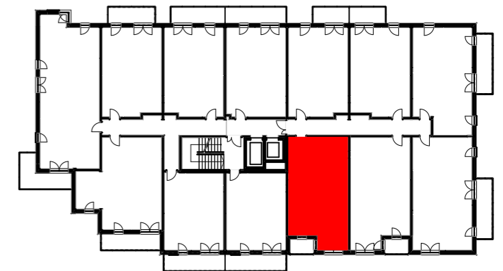
LOKAL MIESZKALNY M49, 3. PIĘTRO