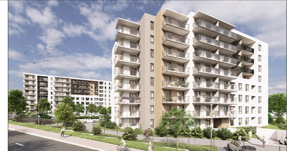
LOKALIZACJA W BUDYNKU B1